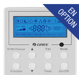
Thermostat filaire (XK-41)