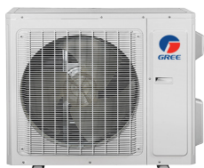
Condenseur LOMO 23