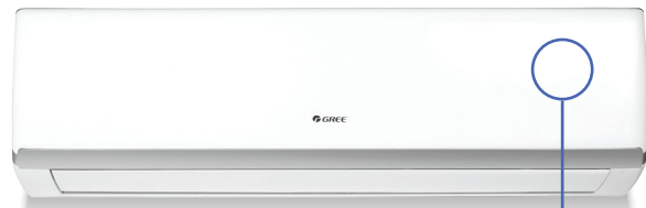
Unité murale LOMO